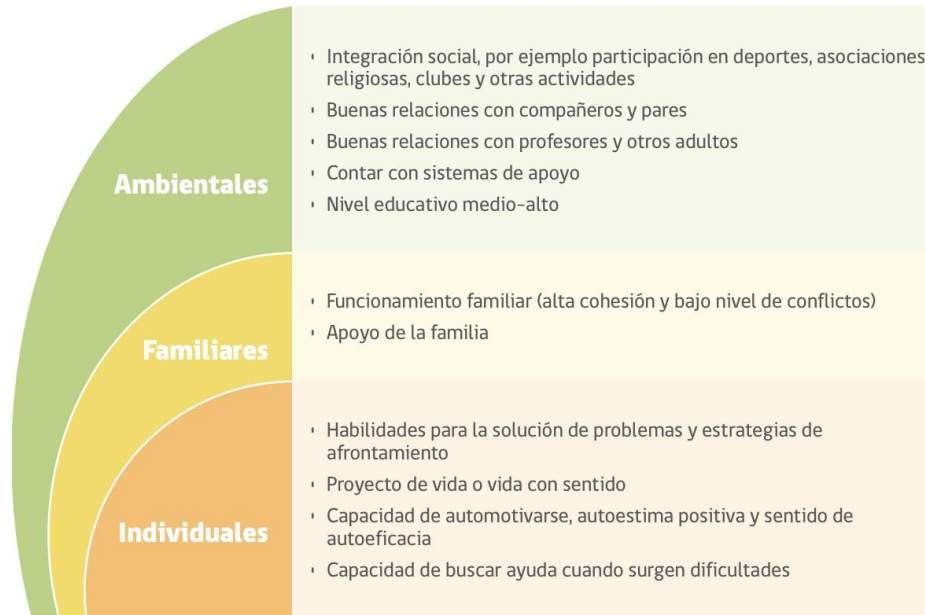
FIGURA 2. FACTORES PROTECTORES CONDUCTA SUICIDA EN LA ETAPA ESCOLAR