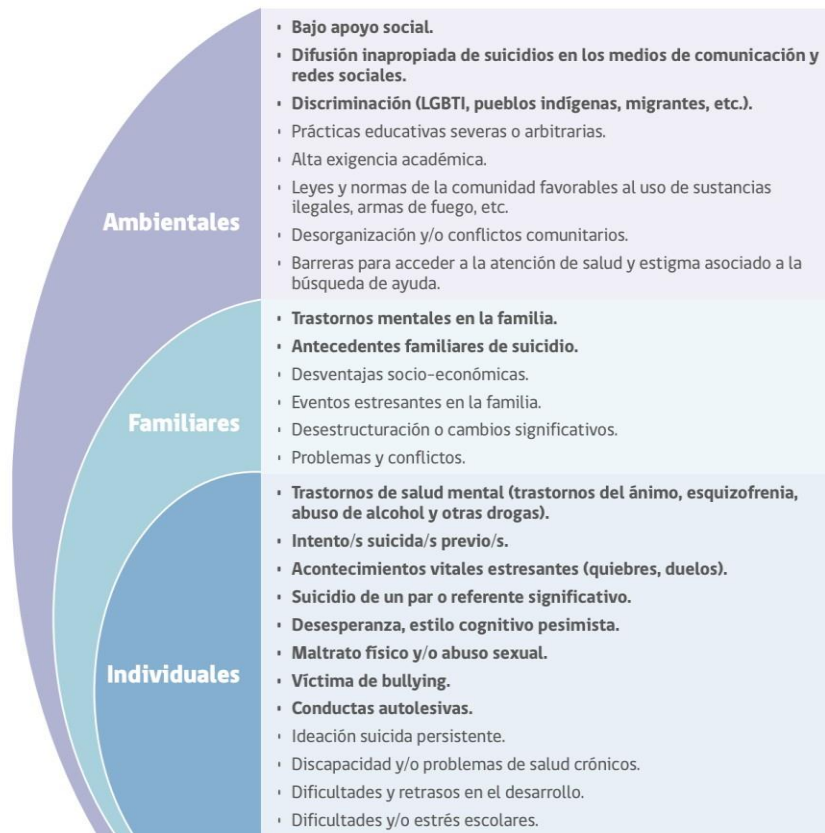
FIGURA 1. FACTORES DE RIESGO CONDUCTA SUICIDA EN LA ETAPA ESCOLAR