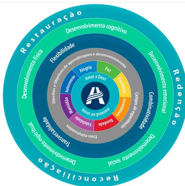
Figura 1 - Design curricular para o Ensino Fundamental