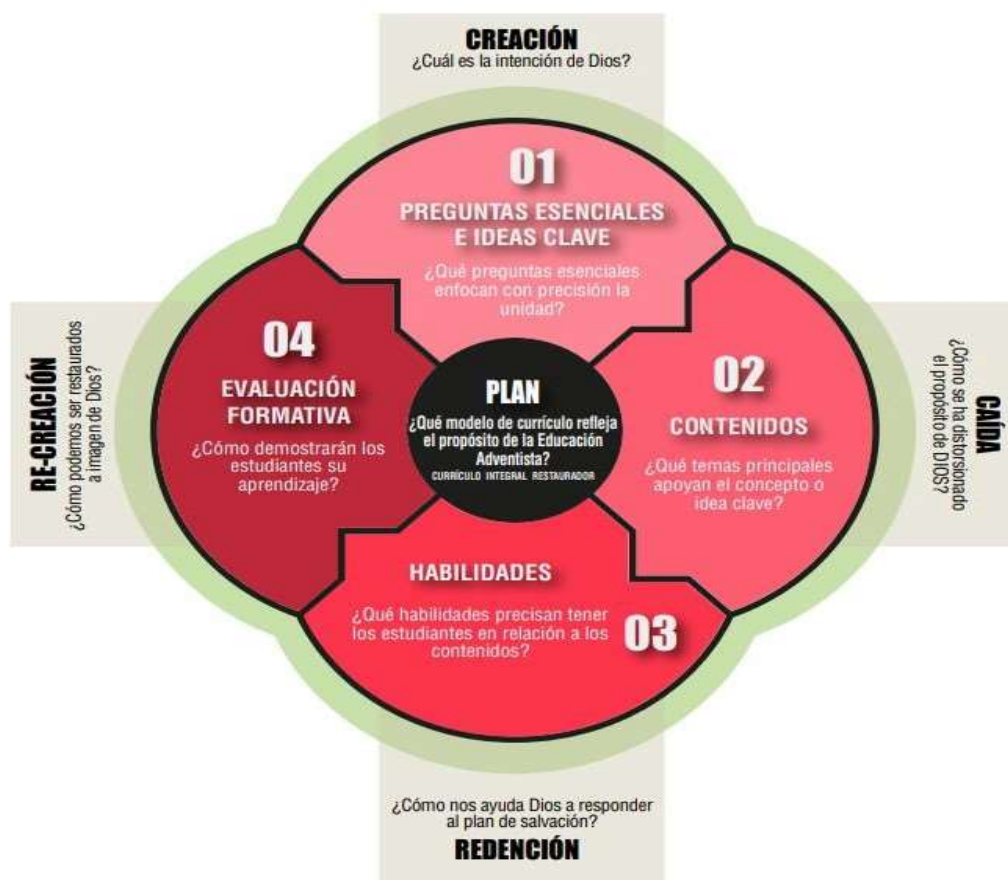
Figura 4: Esquema del plan curricular del Modelo Educativo Adventista - Perú.

El plan o programa curricular responde la pregunta: ¿Cómo puede nuestro currículo reflejar la filosofía adventista? Considerando como mínimo cuatro elementos esenciales en la programación curricular de los diversos niveles se reflejarán los principios filosóficos en la educación adventista.