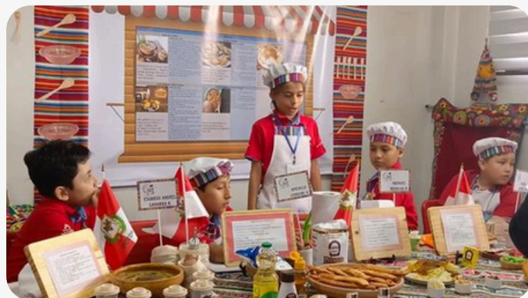
FERIA DE INGLES