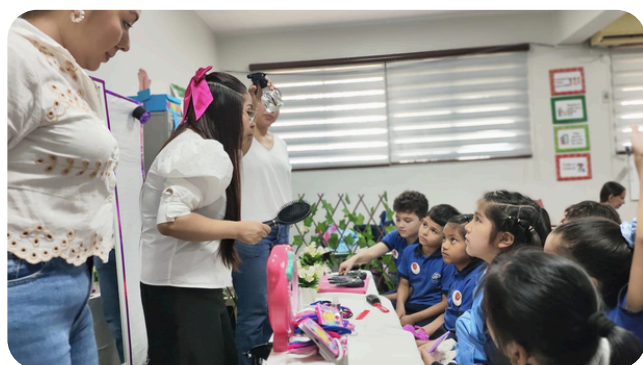
Taller de Cuidado personal