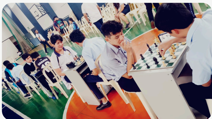
CONCURSO DE AJEDRES, CUBO RUBIC Y ZUDOKU