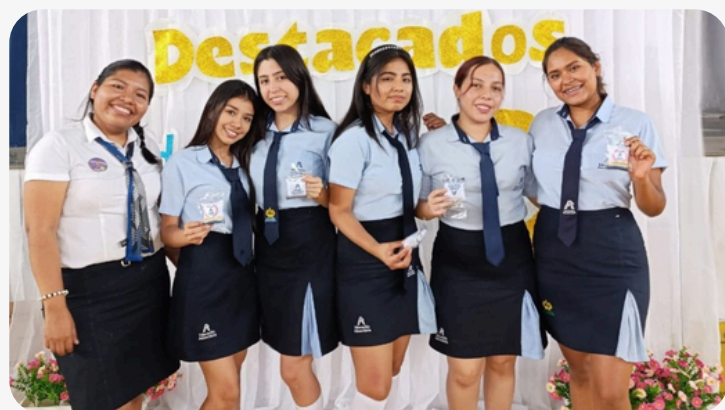
INCENTIVO A ESTUDIANTES DESTACADOS