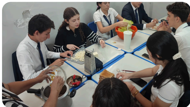
Taller de labores del hogar