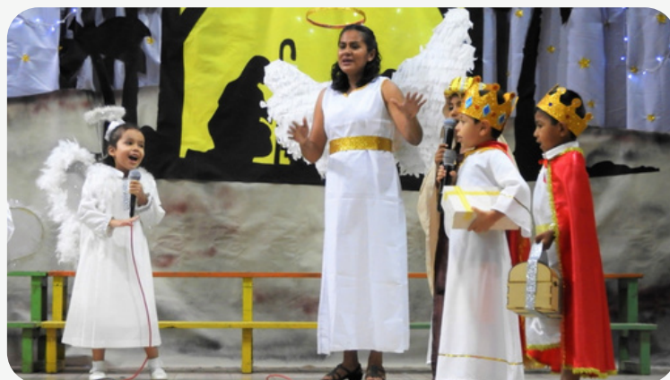
FESTIVAL DE MÚSICA