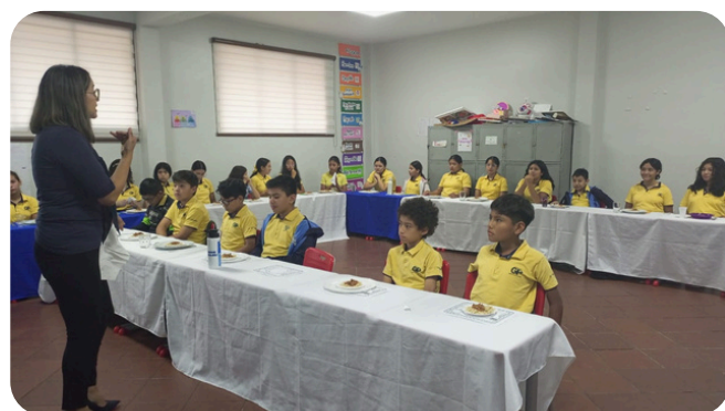
Taller de etiqueta y protocolo