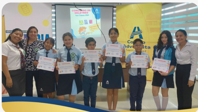
CONCURSO DE DELETREO