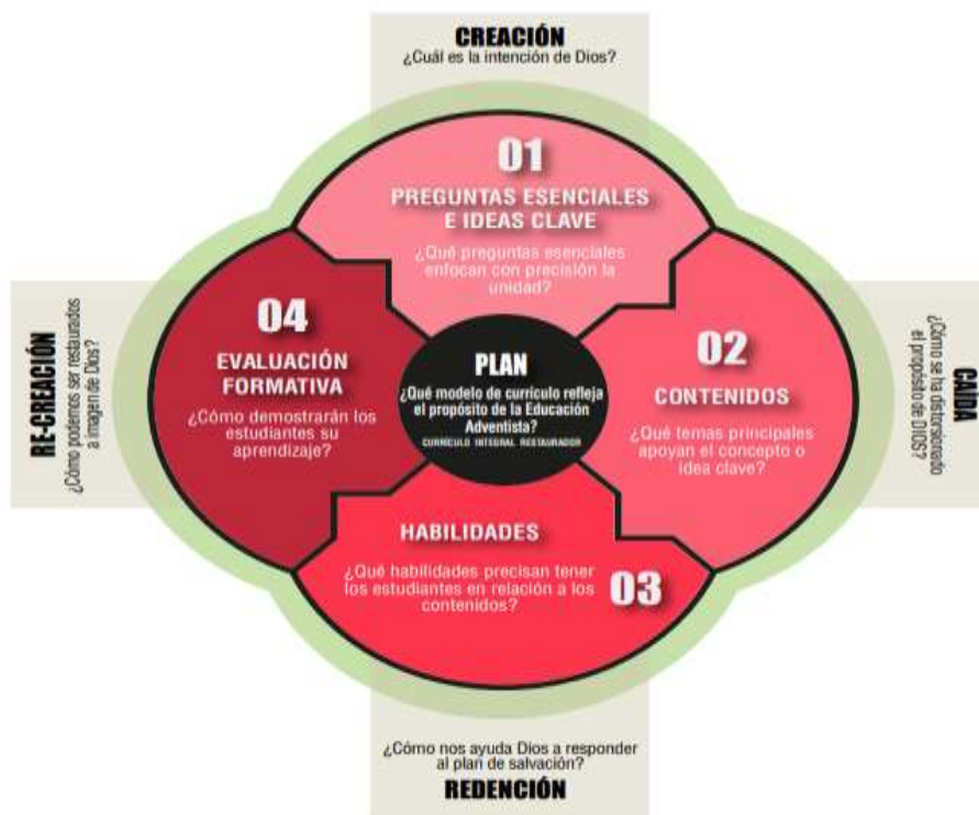
Figura 4: Esquema del plan curricular del Modelo Educativo Adventista - Perú.

El plan o programa curricular responde la pregunta: ¿Cómo puede nuestro currículo reflejar la filosofía adventista? Considerando como mínimo cuatro elementos esenciales en la programación curricular de los diversos niveles se reflejarán los principios filosóficos en la educación adventista.