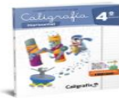
Caligrafía horizontal 4° básico