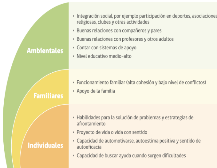
FIGURA 2. FACTORES PROTECTORES CONDUCTA SUICIDA EN LA ETAPA ESCOLAR