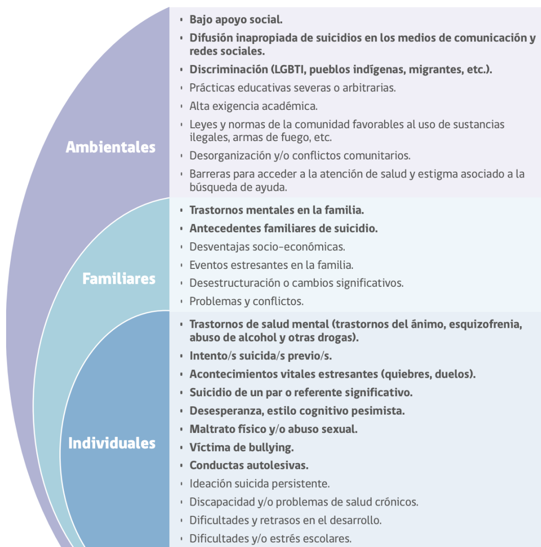
FIGURA 1. FACTORES DE RIESGO CONDUCTA SUICIDA EN LA ETAPA ESCOLAR

Fuente: Elaboración propia en base a Barros et al., 2017; Manotiba's Youth Suicide Prevention Strategy & Team, 2014; Ministerio de Sanidad, 2012; OMS, 2001; OPS & OMS, 2014.