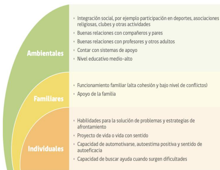
FIGURA 2. FACTORES PROTECTORES CONDUCTA SUICIDA EN LA ETAPA ESCOLAR