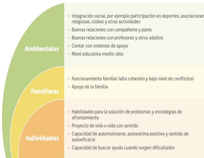
FIGURA 2. FACTORES PROTECTORES CONDUCTA SUICIDA EN LA ETAPA ESCOLAR