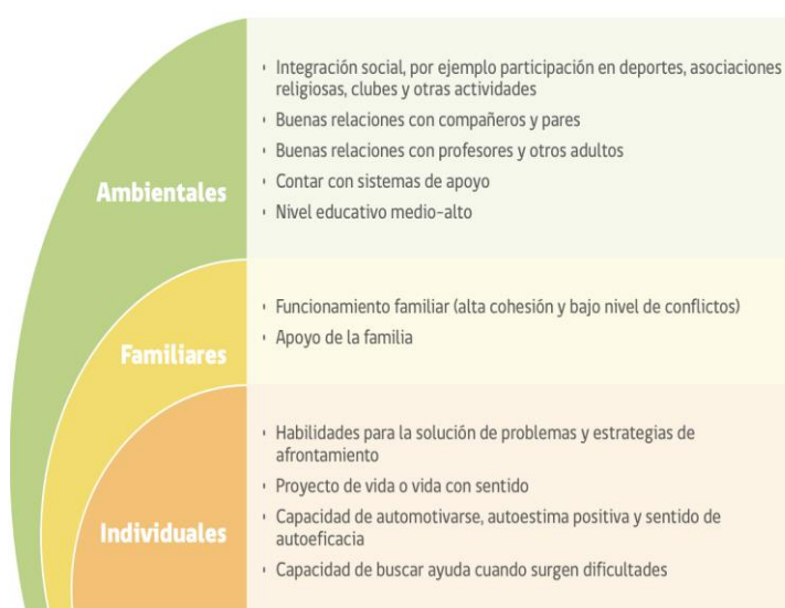
FIGURA 2. FACTORES PROTECTORES CONDUCTA SUICIDA EN LA ETAPA ESCOLAR

Fuente: Elaboración propia en base a Manitoba's Youth Suicide Prevention Strategy & Team, 2014; Ministerio de Sanidad, 2012; OMS, 2001.