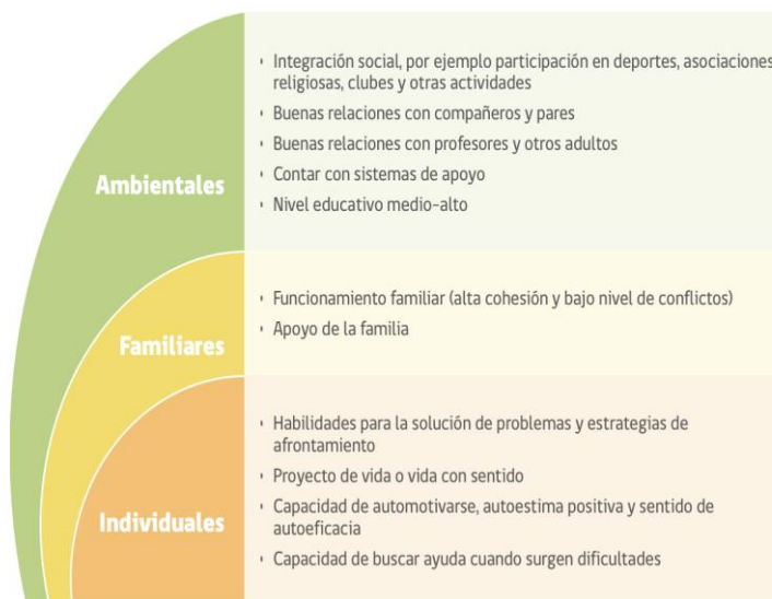
FIGURA 2. FACTORES PROTECTORES CONDUCTA SUICIDA EN LA ETAPA ESCOLAR