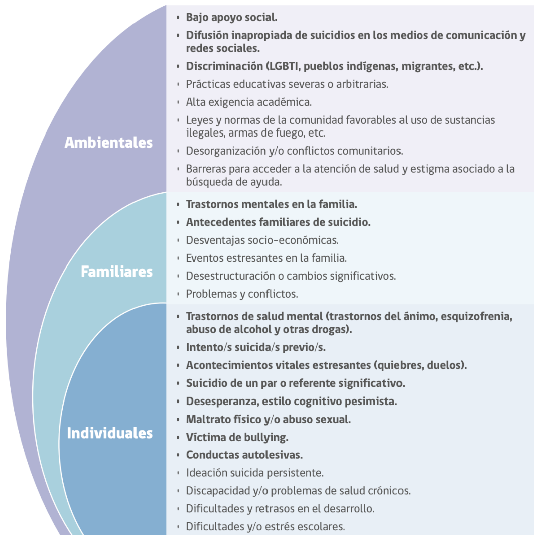
FIGURA 1. FACTORES DE RIESGO CONDUCTA SUICIDA EN LA ETAPA ESCOLAR