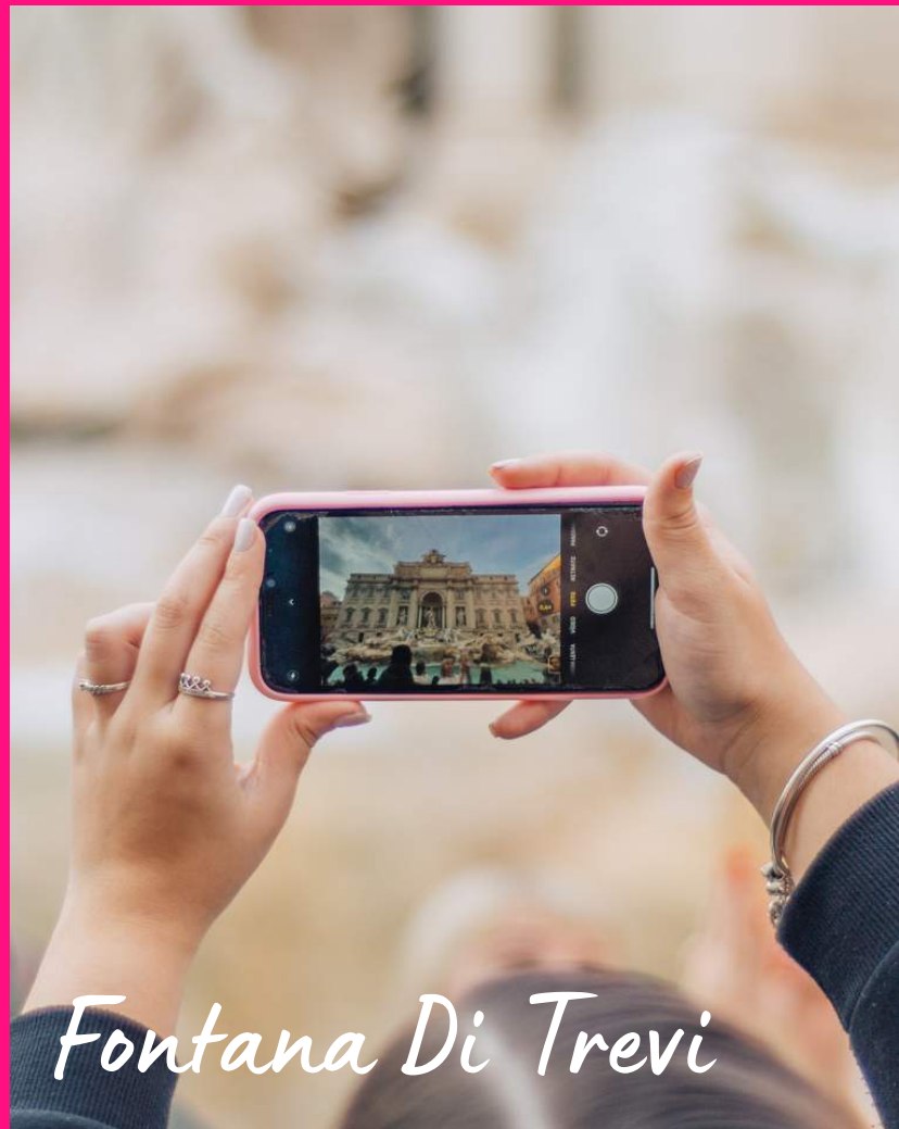
Fontana Di Trevi