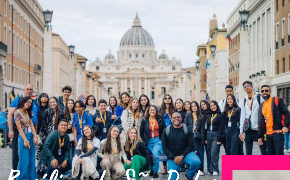
Basilica de São Pedro