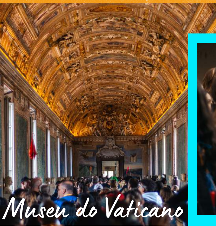
Museu do Vaticano