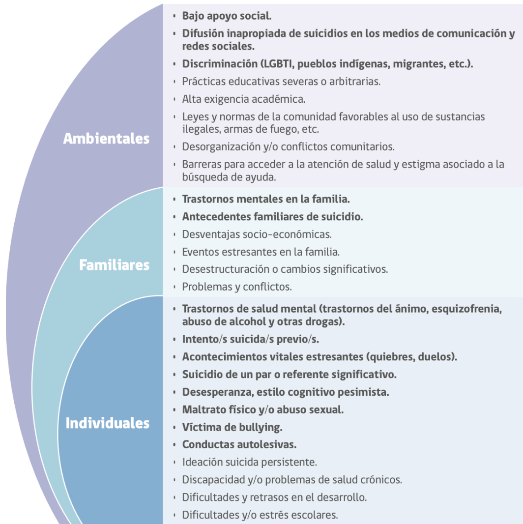
FIGURA 1. FACTORES DE RIESGO CONDUCTA SUICIDA EN LA ETAPA ESCOLAR