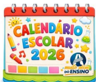
CALENDÁRIO ESCOLAR – MAIO, JUNHO, JULHO E AGOSTO DE 2026 *

Na tabela que segue está o calendário de maio, junho, julho e agosto.