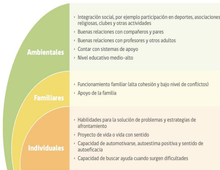
FIGURA 2. FACTORES PROTECTORES CONDUCTA SUICIDA EN LA ETAPA ESCOLAR